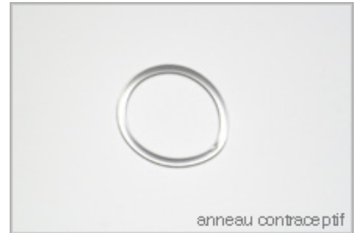
Figure 3 : Anneau Contraceptif