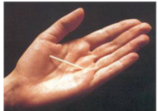
Figure 1 : Implant Contraceptif.

Son action dure entre deux ou trois ans selon le poids de la personne. L'insertion et l'ablation sont considérées des interventions chirurgicales mineures.