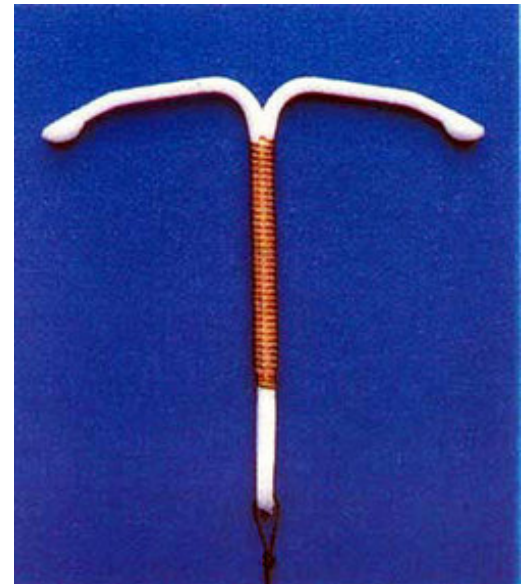
Figure 4 : Stérilet